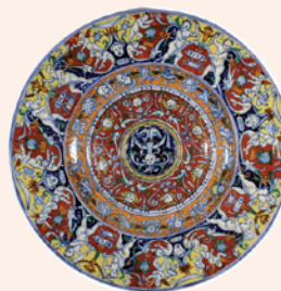
Ekspozat iz Zbirke Muzeja keramike u Montelupu

Zadovoljstvo nam je što PBZ u suradnji s Talijanskim institutom za kulturu u Zagrebu podupire ovaj projekt te vam poklanja besplatan ulaz na izložbu od 16. do 9.6.2019. uz predočenje kupona u ovom izdanju PBZ novosti. Za više informacija posjetite www.muoh.hr .